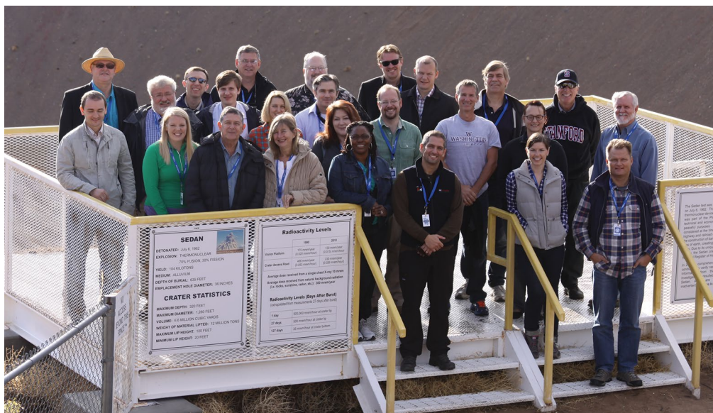
Источник: Режимный объект в Неваде

Участники проекта Verification Pilot Project посетили кратер Седан на режимном объекте в Неваде.